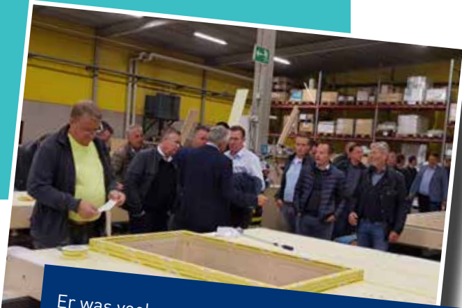
Er was veel aandacht voor de uitleg in de pre-fab houtskeletbouw gevelementen fabriek.