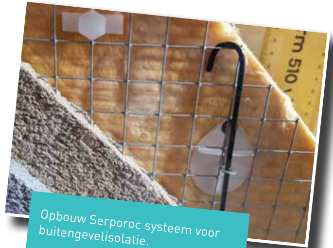
Opbouw Serporoc systeem voor buitengevelisolatie.