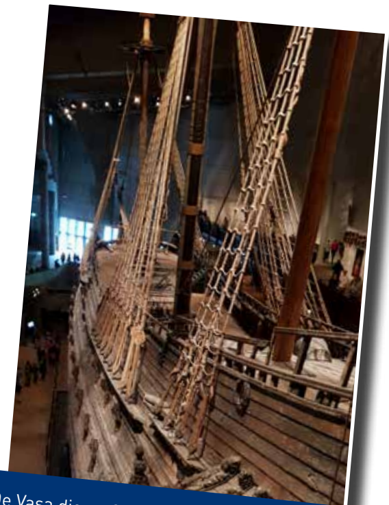
De Vasa die na 333 jaar weer boven water werd getakeld en gedurende tientallen jaren werd geconserveerd.

dings, BIM, vocht, akoestiek, comfort, passieve en actieve sensoren in vloeren en wanden die vocht en R-waarden monitoren en de optimalisering van het bouwproces. Duizelt het u? U staat niet alleen.